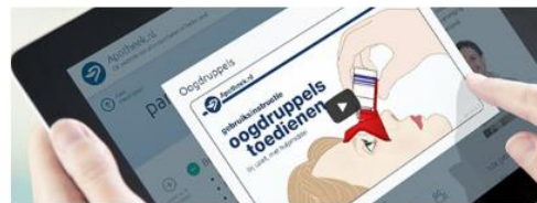
Instructievideo's over medicijnen