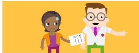
Animatievideo's radiologische onderzoeken