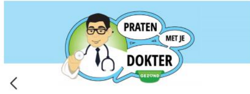
Gezond praten met je dokter