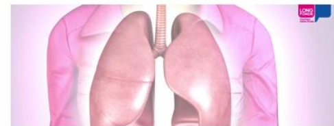
Video's uitleg longziektes