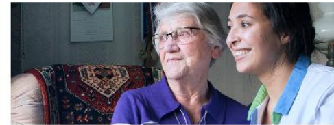
Video's: zelfmanagement en gezondheidsvaardigheden